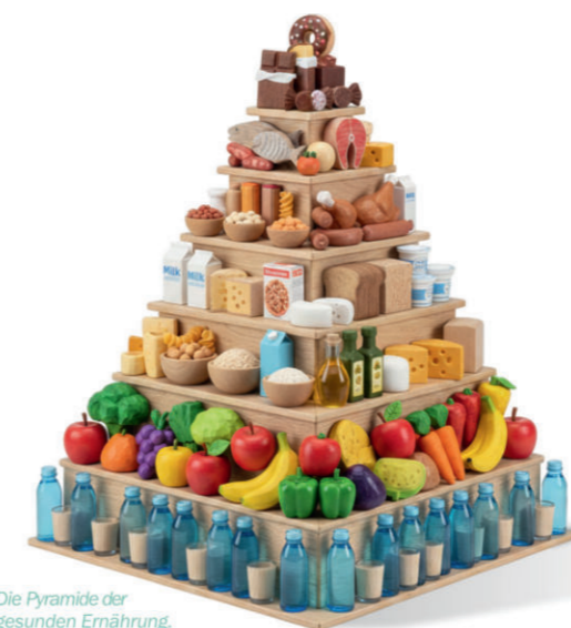
Die Pyramide der gesunden Ernährung.

Mundpflegeset: Der Patient erhält zu jeder Monatslieferung ein komplettes Mundpflegeset sowie bei Bedarf eine Lippenpflege.